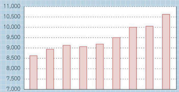
全国の家裁裁判所に持ち込まれた遺産分割調停件数